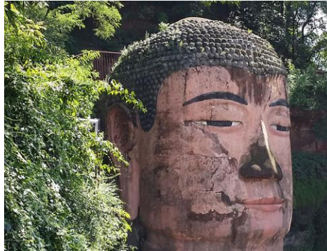
تمثال بوذا العملاق